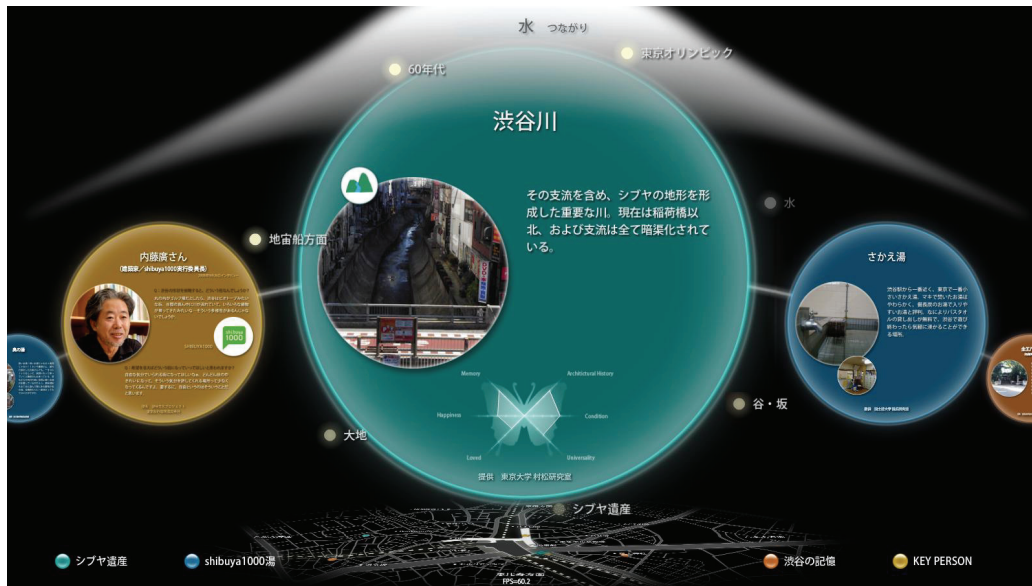
図 3. 画面表示例（つながりワード「水」でつながる渋谷のスポット）