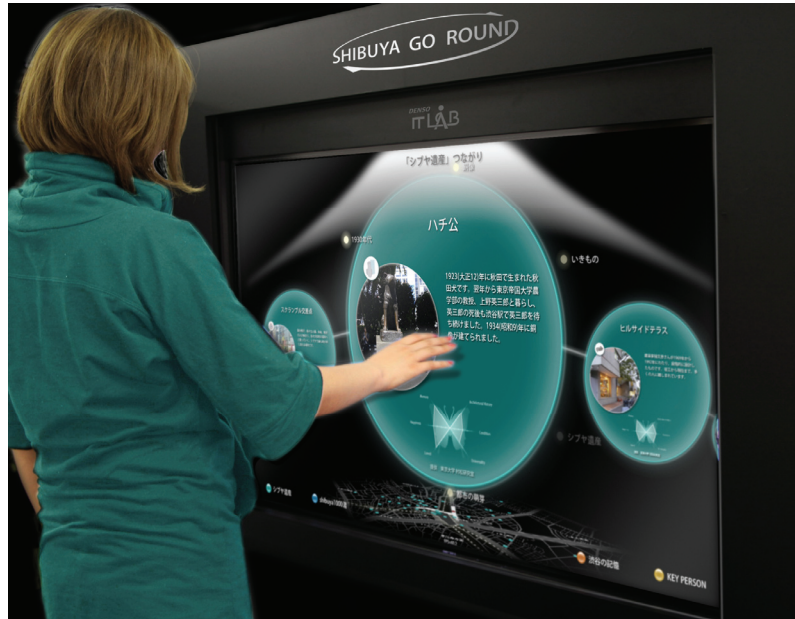
図 1. 「SHIBUYA-GO-ROUND」